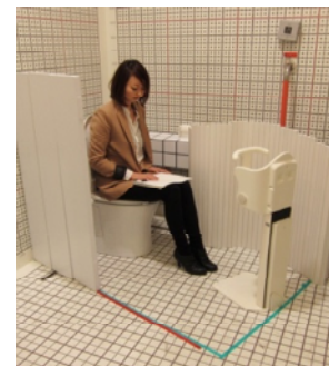
研究施設での空間検証