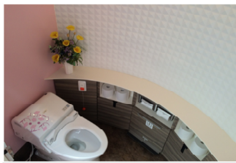
ゆとりがあり機能的な室内空間