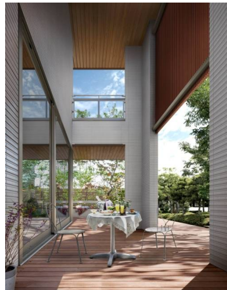
ダイナミックな「アウターダイニング」

積水ハウスは、先進の技術で快適な暮らしを、というブランドビジョン「SLOW & SMART」を掲げています。木造住宅「シャーウッド」の魅力を更に高め、「スローリビング※」をはじめとする潤いのある暮らし提案を今まで以上に積極的に推進し、高級木造住宅市場におけるシェア拡大を図ります。