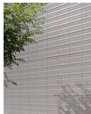
スティックボーダー柄

焼き物ならではの独特な風合いを持ち、耐候性や耐水性、防耐火性に優れているオリジナル陶版外壁「ベルバーン」に、4種類目のデザインとなる「スティックボーダー柄」を新設しました。繊細で上質な質感を伴った、表面を粗目に仕上げた和テイストの細割りデザイン柄で、「ザ・グラヴィス 2014 edition」の外観に更なる上質さを醸し出し、まちなみにも調和します。