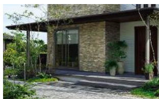
フラットバイザー

また、「木調縦格子ルーバーバルコニー」は、外からの視線を遮りながら通風を確保。美しい木調仕上げでまちなみに落ち着きのある印象を与えます。