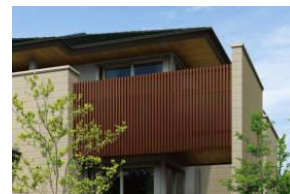
木調縦格子ルーバーバルコニー