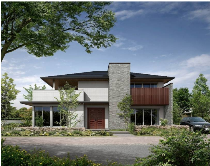
邸宅感のある外観