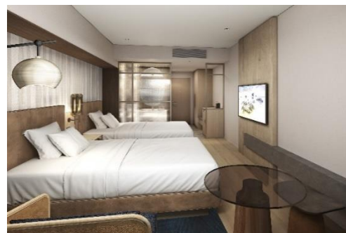
<デラックスツイン客室イメージ>