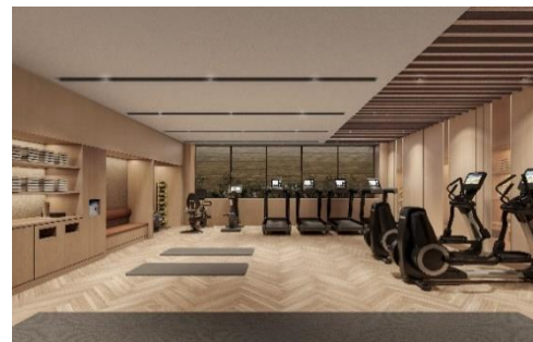
<フィットネスセンター イメージ>