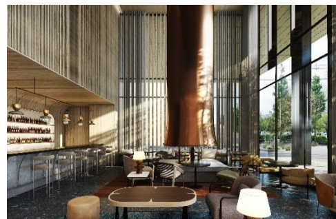
<THE LOUNGE イメージ>