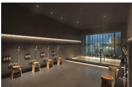
<温浴施設 イメージ>

宿泊ゲスト専用の施設として、モダンジャパニーズスタイルの温浴施設は、一日の締めくくりに、最高のくつろぎを提供します。また、24 時間利用可能なフィットネスセンターは、スタイリッシュなデザインの空間に、Technogym の最新機器を配備し、充実した毎日を過ごすコートヤード・バイ・マリオットのゲストのウェルネスをサポートします。