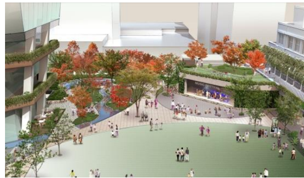
広場西側からイベントホールを望む

*MICE : Meeting (会議・研修・セミナー)、Incentive tour (報奨・招待旅行)、Convention または Conference (大会・学会・国際会議)、Exhibition (展示会) の頭文字をとった造語で、ビジネストラベルの一つの形態。