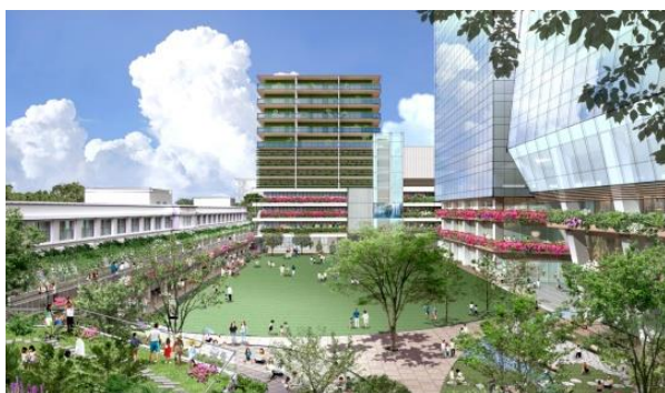
広場東側からオフィス棟を望む

都心にありながら約 3,000 ㎡の広大な広場を設け、イベントホールとの一体的利用による憩い・賑わいの創出や、コーキングスペースなどによる企業や人材の交流など、世界や地域との多様な交流拠点を目指しています。