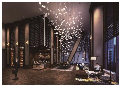
カンファレンス ラウンジ (3 階)