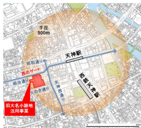
天神ビッグバン対象エリア