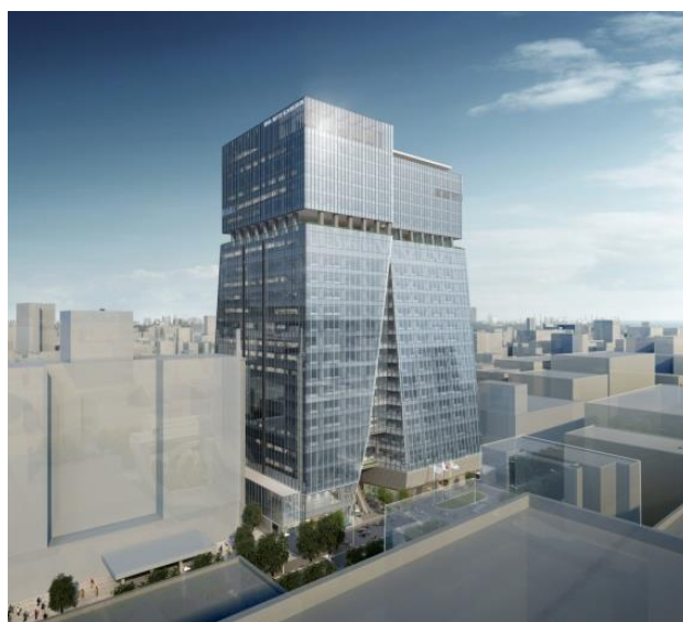
明治通り東側からの全景