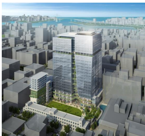
南東上空よりの全景