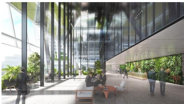
オフィス スカイロビー (3 階)

総面積 約 30,000 ㎡となるオフィスは、基準となるフロアのワンフロアの専有面積が約 2,500 ㎡となる九州最大級の自由度の高い計画となっています。加えて、高度なセキュリティ機能と十分な BCP 性能、耐震性を備えた安全・安心のハイグレードなオフィスです。MICE*機能も備えており、グローバルビジネスを呼び込むことも可能です。また、旧大名小学校南校舎に構えるスタートアップ支援施設と連携し、企業の成長をバックアップする コーキングスペース、イベントホール等からなる施設構成により、企業の創業や成長、および人材の育成に適した環境を提供します。