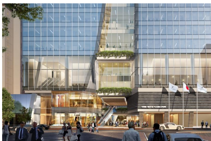
明治通りからの近景