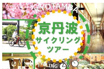
株式会社あさひとの サイクリングツアー