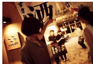
株式会社信濃路の 道の駅に併設「すさみ夜市」