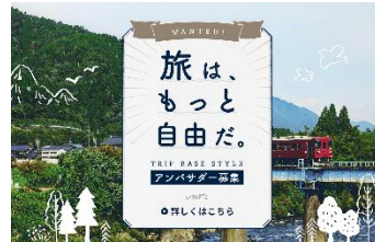
「TRIP BASE STYLE アンバサダー」 旅のスタイル発信の企画運営