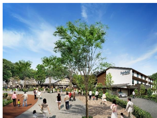
Trip Base 道の駅プロジェクト イメージ

TRIP BASE STYLE トリップベーススタイル【公式 Instagram】 https://www.instagram.com/tripbasestyle.official/