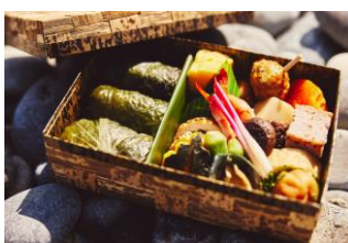
各道の駅・地元企業と連携 地域の素材満載「朝食ボックス」