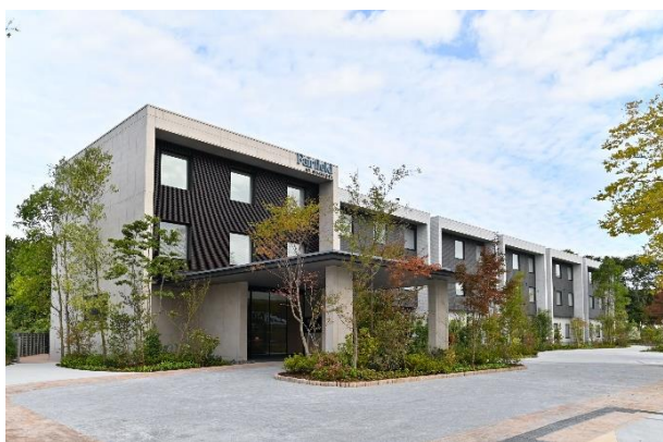
フェアフィールド・バイ・マリオット・栃木宇都宮 外観

世界各国に1,150軒以上のホテルを展開する、フェアフィールド・バイ・マリオットは、信頼のおけるサービスや温かみのある心地よい空間により、シームレスな滞在をお届けできるようデザインされています。フェアフィールドは、無料 Wi-Fi に加え、丹念にデザインされたゲストルームや、リビング、ワーキングスペースを提供しています。詳しい情報は、 fairfield.marriott.com をご覧ください。また、Facebook や Twitter (@FairfieldHotels) にて最新情報もご確認いただけます。