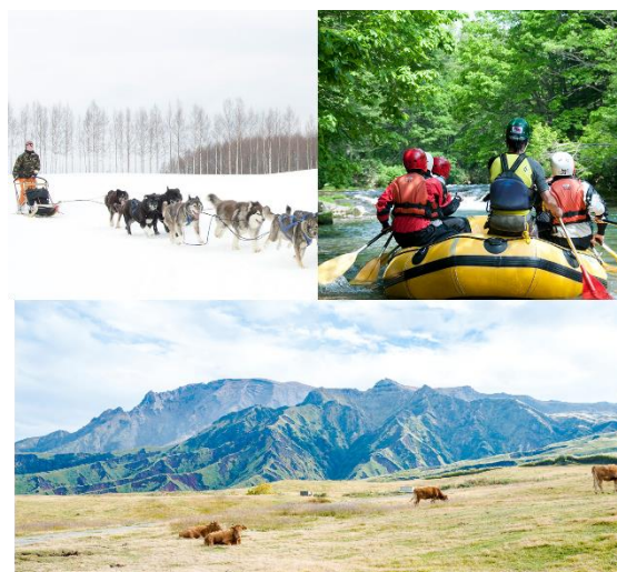
各地の魅力あふれるアクティビティ

「Trip Base 道の駅プロジェクト」は、「未知なるニッポンをクエストしよう」をコンセプトに、地域や自治体、パートナー企業とともに、観光を起点に地域経済の活性化を目指す地方創生事業です。「道の駅」を拠点に、「地域の知られざる魅力を渡り歩く旅の提案」を通して、地方創生の一助となることを目指しています。宿泊特化型ホテルで、食事やお土産などは道の駅をはじめとする地域のお店を利用させていただくことで、地域の人々との交流や道の駅との往来を促す設計となっています。