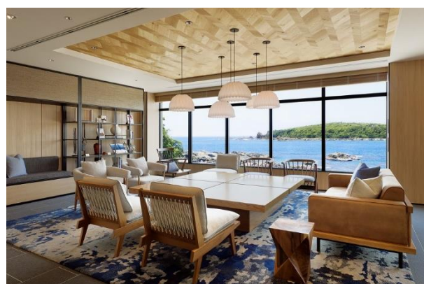
フェアフィールド・バイ・マリオット・和歌山すさみ ロビーライブラリー

さらに、フェアフィールドは、数多くの受賞歴を誇る旅行プログラム、Marriott Bonvoy（マリオット ボンヴォイ）に参加しています。本プログラムは、会員の皆様に類を見ないグローバルブランドの数々や Marriott Bonvoy Moments での会員限定の体験、そして無料の高速 Wi-Fi 接続や会員限定の特別料金をご利用いただけるほか、マリオットのモバイルアプリでは、モバイルチェックイン&チェックアウト、モバイルリクエスト、ホテルではモバイルキーがご利用いただけます。Marriott Bonvoy への無料会員登録やプログラムについての詳細は、 MarriottBonvoy.com/jp をご覧ください。