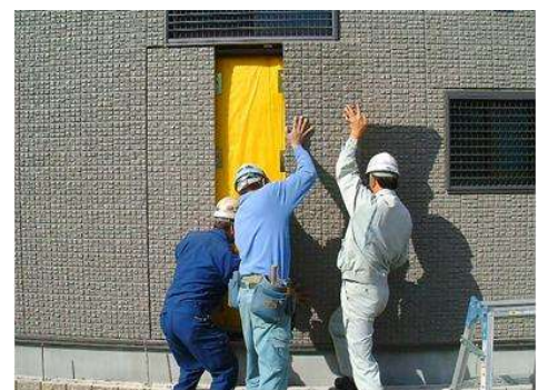
屋外から外壁を交換・固定