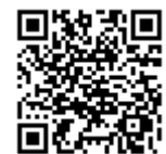
動作イメージは上記から確認できます。