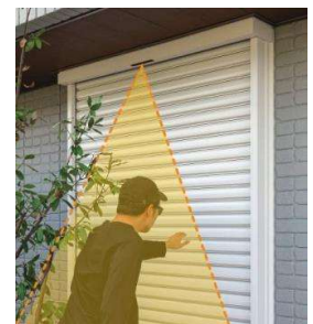
センサーが不審者に反応