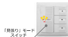
「見張り」モードスイッチ