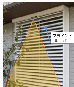
ルーバーが開いた状態で見張る