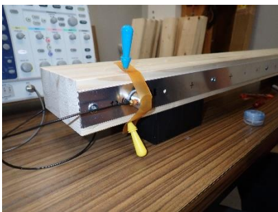
図 1 試験の様子

以上より、ウェーブガイドを用いることによる検知感度向上が認められ、より効率的に検知することが可能となった。なお、ウェーブガイドの形状および接合方法、木材への固定方法などの詳細は発表により行う。